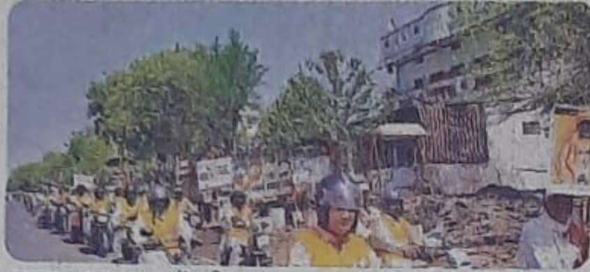
राजगढ़. बाइक यात्रा में शामिल लोग।