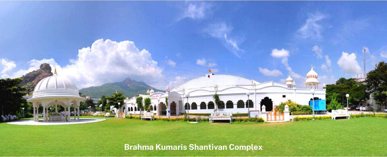
Brahma Kumaris Shantivan Complex